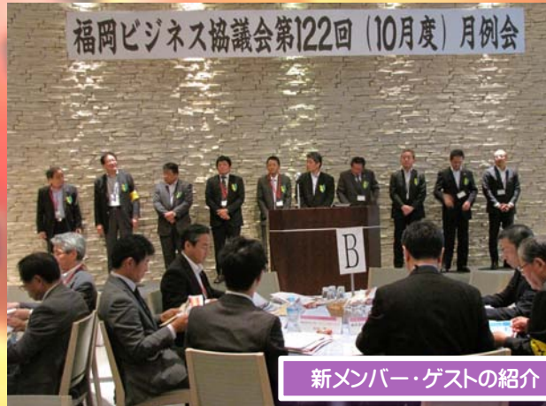
新メンバー・ゲストの紹介