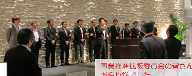
事業推進拡販委員会の皆さん お疲れ様でした。