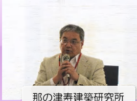
那の津寿建築研究所