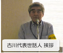
古川代表世話人 挨拶