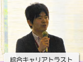
総合キャリアトラスト