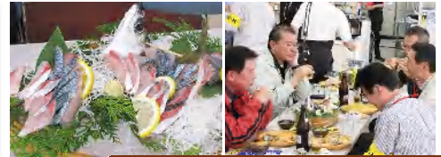
松浦市の皆様 ありがとうございます。