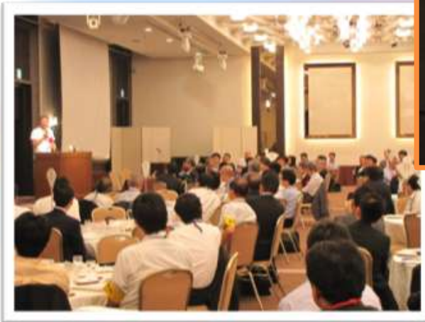
演題 「私の体験した ディズニーマジック・感動を呼ぶ サービス！」