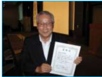
新規会員推薦賞 株式会社テクニカルライト