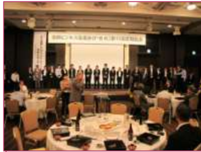
新メンバー・ゲストのご紹介