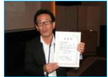
新規会員推薦賞 株式会社リフティングブレン