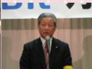
石川副代表世話人挨拶