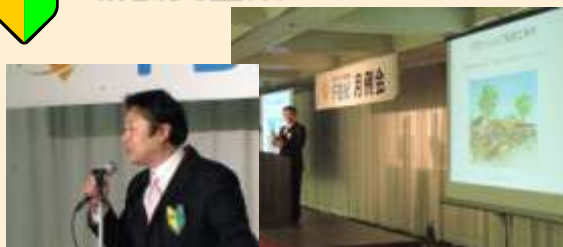
株式会社荻田商業建築デザイン事務所