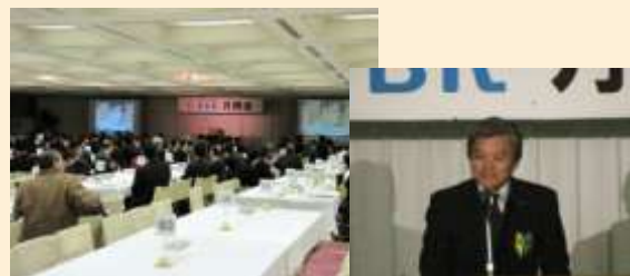
栗山土地家屋調査士事務所