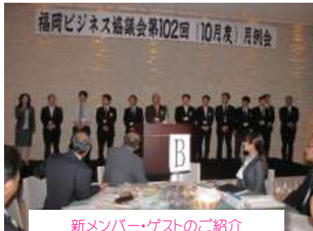
新メンバー・ゲストのご紹介