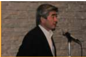
古川代表世話人挨拶