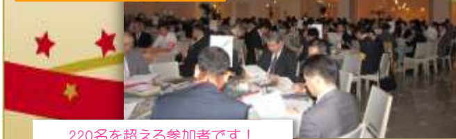
220名を超える参加者です!