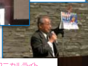
緊急提案:テクニカルライト