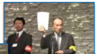
分科会からの連絡: 山歩の会