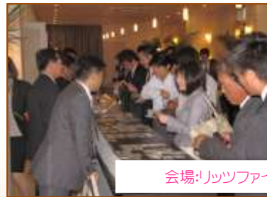
会場:リッツファイブ