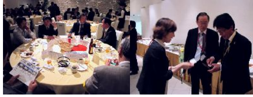
交流会では料理とお酒でさらに 交流が深まります