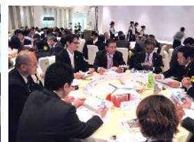
ゲスト参加の分散会風景