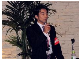
交流会司会のさん (福岡電送機器)