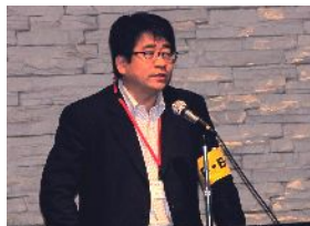
ご挨拶の上野副代表世話人 (日立製作所)

ゴルフ愛好会より5月に実施した「九重町・FBK親善ゴルフコンペ」よりチャリティー寄付金を、宮崎県福岡事務所へ「口蹄疫義捐金」を贈呈いたしました(22,782円)。また月例会では募金活動を行い、後日福岡事務所へ届けてまいりました。参加の皆様のご善意ありがとうございました。