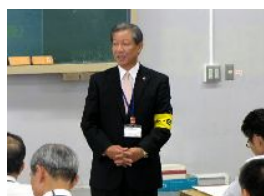
ご挨拶の石川代表世話