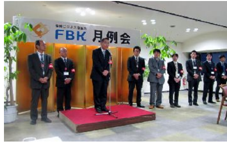
担当の研修委員会の皆さん