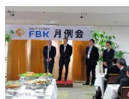
新メンバー・ゲスト紹介