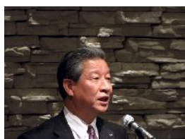
ご挨拶の石川代表世話人