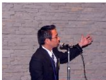
(株)雲仙きのこ本舗