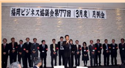
3月月例会担当のWEB委員会の皆さん