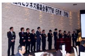
新メンバー・ゲスト紹介