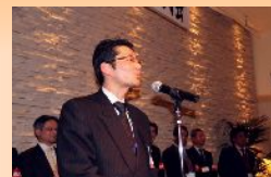
中閉めの神宮さん(正興商会)