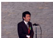
(株)ダイヤモンドテレコム