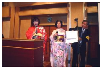
キャンペーン抽選会

事業推進充実委員会では新年の月例会で女性陣はきものによる皆様の歓迎をしようと、張り切って準備をされました。一段と華やかな新年会になりました。昨年の「よか値マル得キャンペーン」のプレゼント賞品の抽選会の実施や当日ジャンケン大会の実施で大変盛り上がりしました。 キャンペーンの賞品提供をいただいた会員企業の皆様ありがとうございました。今後ともよろしくお願いいたします。