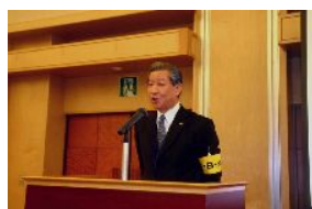
ご挨拶の石川代表世話人