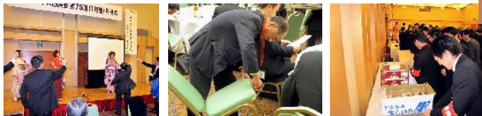
会場の椅子にも抽選の仕掛けがありました。