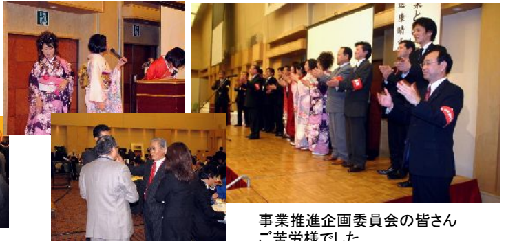
事業推進企画委員会の皆さんご苦労様でした