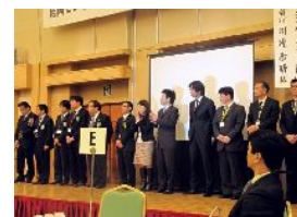
新メンバー・ゲスト紹介