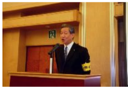
ご挨拶の石川代表世話人