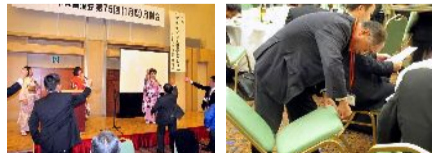
会場の椅子にも抽選の仕掛けがありました。

ジャンケンにて記念品の提供会社 ・サッポロビール(ビール) ・ミナミ商事(キャンノンデジカメIXY) ・九重町(お米・イノシシ肉・椎茸・ヨーグルト) ・九重森林公園スキー場(招待券、割引券)