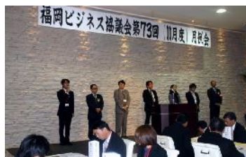
新メンバー・ゲスト紹介