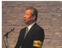
石川世話人代表の挨拶