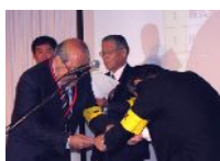
(株)テクニカルライ