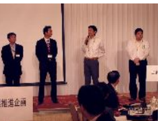
新メンバーの皆さん