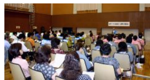
FBKの概要説明と各温泉郷の説明