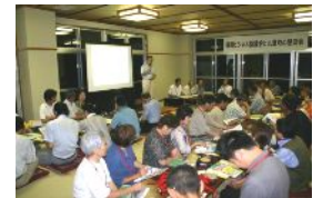
「九重飯田高原デザイン会議」 との意見交流会

福岡ビジネス協議会(FBK)事務局 E-Mail: fbk@cnc.bbq.jp 〒812-0008 福岡市博多区東光2-7-25 株式会社正興電機製作所(内)別館1階