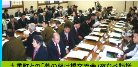
九重町との「夢の架け橋交流会」夜なべ談話