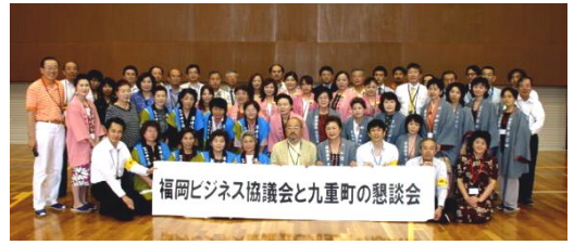
福岡ビジネス協議会と九重町の懇談会 ニュービジネス分科会では村興し町興しに取り組んでいます 「九重町3湯の女将さんとの意見交換会」

福岡ビジネス協議会 FBK 月刊福岡ビジネス協議会 発刊日:平成20年8月19日 この内容は下記のFBK WEBサイトで ご覧いただけます。 http://www.fbket.com