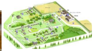
会場の「泉水グリーンパーク」