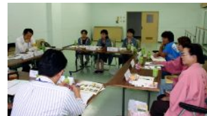
6グループに分かれての意見交換会