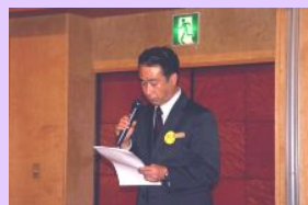
KKRホテル博多のご挨拶