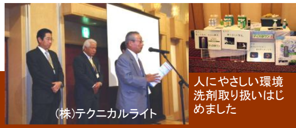
(株)テクニカルライト