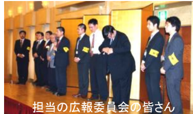
担当の広報委員会の皆さん

7月10日臨時総会を開催いたします。多くの会員の皆様の出席をお願いいたします。 規約改正と「専従事務局設置財源確保に関する月会費の改定」