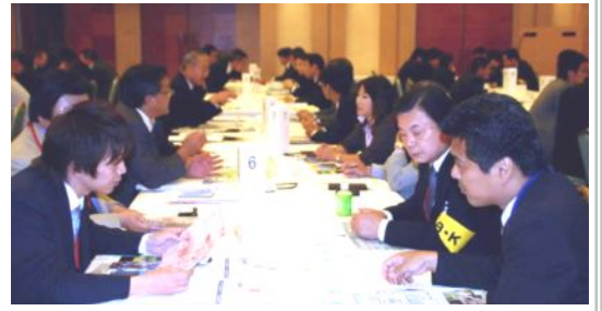
「企業お見合い大会」でお互いの企業が商談のきっかけを!

企業お見合い大会・定例会・懇親会 第60回(08年6月度)月例会 開催 2008年6月12日(木)