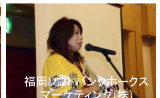
福岡シティバンクホークスマーケティング(株)