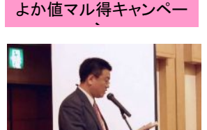
よか値マル得キャンペーン

第60回(08年6月度)月例会は6月12日(木)KKRホテル博多で開催いたしました。企画行事として「第7回企業お見合い大会」を開催しゲストを含め104会員の皆様により行われました。 【開催内容】