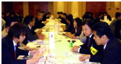
「企業お見合い大会」熱心に自社のPRを行い商談のスタートに