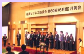
新会員とゲストの皆さん