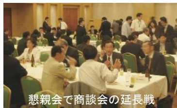
懇親会で商談会の延長戦