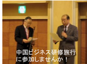
中国ビジネス研修旅行に参加しませんか！