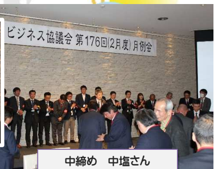
広報委員会の皆さんお疲れ様でした!