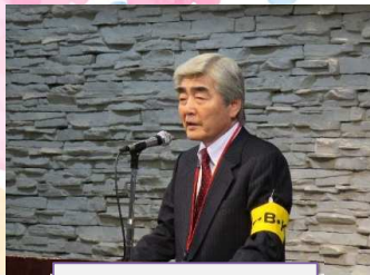
古川代表世話人挨拶