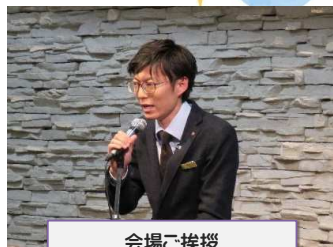
会場ご挨拶 リッツファイブ村様