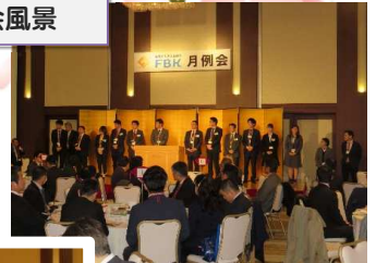
昨年の 月例会風景