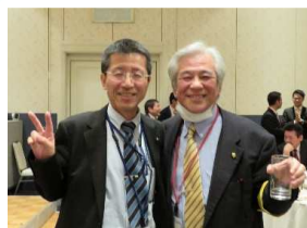
広報委員会の皆さん お疲れ様でした！