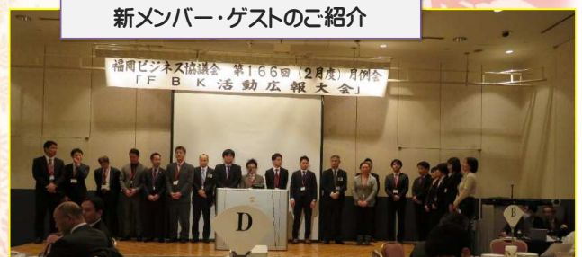
新メンバー・ゲストのご紹介