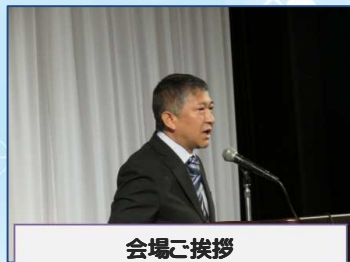
会場ご挨拶 ソラリア西鉄ホテル様