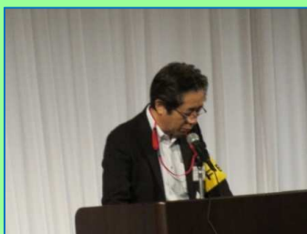
迫田副代表世話人