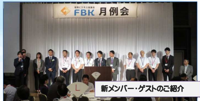
新メンバー・ゲストのご紹介

7月度「プレ総会」では「会員アンケート状況報告」、 各委員会・分科会「17年度活動報告」「18年度活動計 画」が発表されました