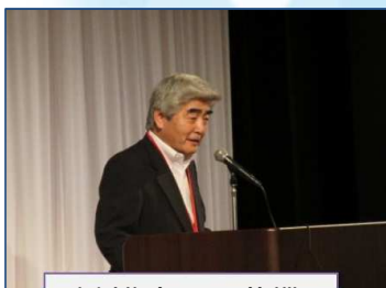
古川代表世話人挨拶