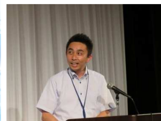
株式会社太田旗店