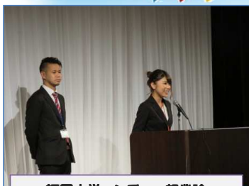
福岡大学ベンチャー起業論 林田さん・村田さん イベント告知