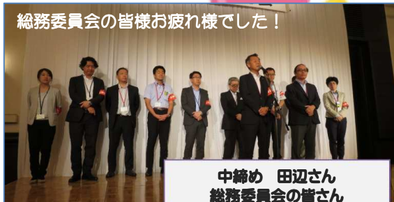
総務委員会の皆様お疲れ様でした！