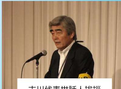
古川代表世話人挨拶