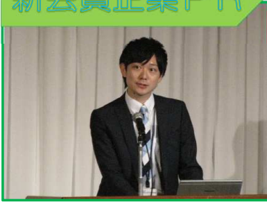
ウイングアーク1st株式会社