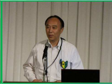
株式会社 セイシン・コンピタンス・ サポート