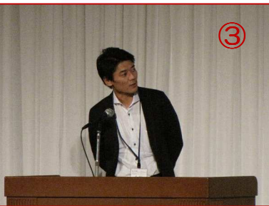
①松浦市福岡事務所 ②NPO法人九重夢創造塾 ③株式会社ナイチンゲール