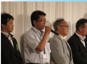
新メンバー・ゲストのご紹介