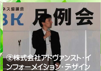
②株式会社アドヴァンスト・イン フォメーション・デザイン