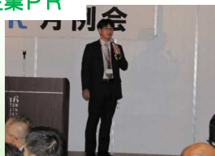
株式会社グローバルアリーナ