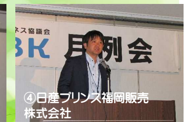
④日産プリンス福岡販売 株式会社