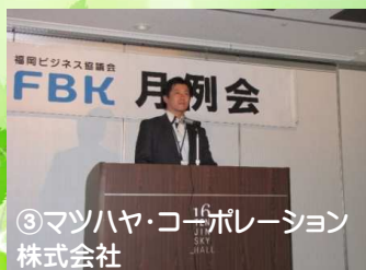
③マツハヤ・コーポレーション 株式会社