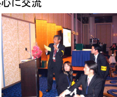
キャンペーン抽選会