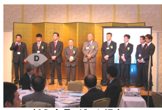
新入会員・ゲスト紹介