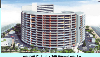
すばらしい建物です 2007年春・入居者募集開始