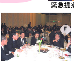
分散会で熱心に交流