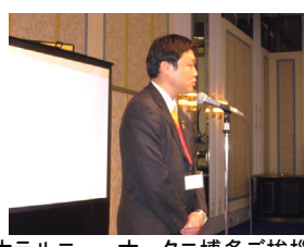
ホテルニューオータニ博多ご挨拶