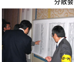
抽選結果300名の発表