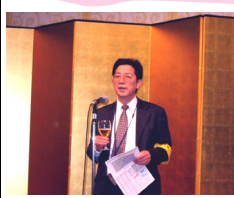
懇親会で「今年もガンバロー！」