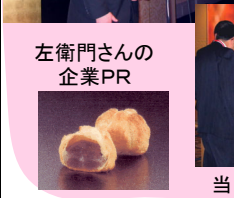
左衛門さんの企業PR