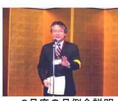
2月度の月例会説明 組織拡大委員長