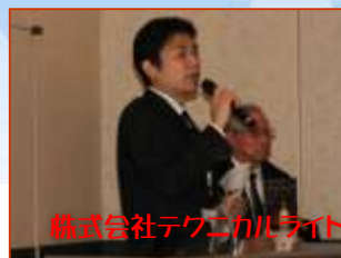
株式会社テクニカルライト