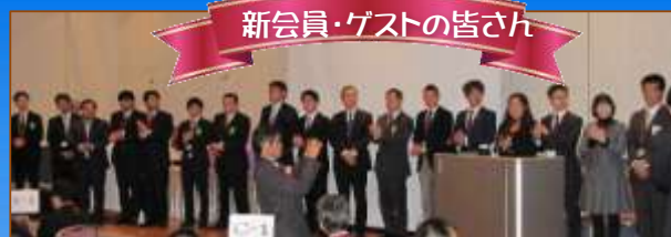
新会員・ゲストの皆さん