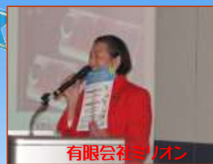
有限会社ミリオン