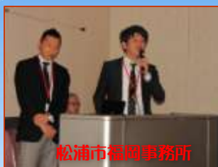
松浦市福岡事務所