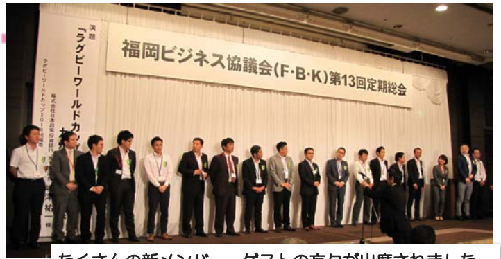
たくさんの新メンバー、ゲストの方々が出席されました。